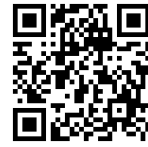
重ねる ハザードマップ